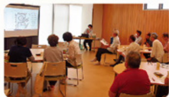
9月 歴史民俗資料館から講師をお招きし、蟹江町の歴史について説明していただきました。時代の移り変わりとともに蟹江町がどのように変化してきたのか当時の写真や絵を見ながら、その歴史と背景について学びを深めました。