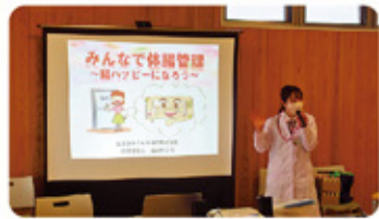
1月 名古屋ヤクルト販売株式会社様をお招きし、腸の健康に関する講演をしていただきました。腸の動きについて理解を深め、健康な生活を続けていくための学びの機会となりました。

令和6年度は「かにえカルタづくり」や「認知症に関する勉強会」など月にプログラム内容を変え、交流会を行っていきます。このように交流会では、学習することだけでなく、サポーター同士で楽しむことのできる内容も開催し、つながりを作り、お互いに無理なく活動を続けています。今年度もかにまるサポーターに登録することができる地域支えあいサポーター養成講座を開催する予定です。地域の活動に興味・関心のある方は、お気軽に問合せください。