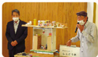
11月 かにえ防災減災の会様をお招きし、伊勢湾台風の状況説明と災害時の避難方法について説明していただきました。サポーターの皆さまにとって、常日頃から持っている防災の心構えをより一層引き締める機会となりました。