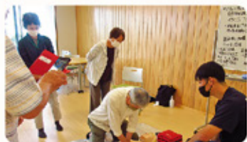
7月 蟹江消防署から講師をお招きし、「救命講習」を行いました。心肺蘇生術、熱中症予防と応急手当について説明してもらいました。人形を使用して実際に胸骨圧迫やAEDの実技体験を行いました。

毎月1回、かにまるサポーターの仲間が集まって「交流会」を開いています。「交流会」の内容は、サポーターとしての見識を深めるための学習や、情報共有、レクリエーションなど多岐にわたります。令和5年度の主な内容をご紹介します。